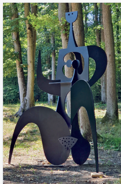
Marathonienne, 1981-2004, acier peinture Epoxy noire, H. 350 x L. 252 x P. 138 cm.

De New York à Paris, des Musées d'Arts premiers aux Salon de la Noblesse, cet amoureux des femmes, protégé de Germaine Richier, ami d'Arman, César, Jodorowsky ou Alain Jouffroy, Officier de L'Ordre National des Arts et Lettres, bon vivant et grand amateur de cigares a su, tout au long de sa vie, totalement bouleverser notre regard sur la sculpture.