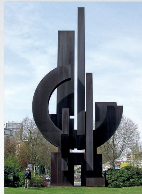
Liberté , 1990-92, Sculpture monumentale H. 21 m, acier Corten, Fontenay-sous-bois (Val de Marne, France).