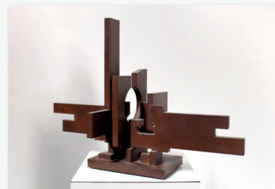
Parcours Sans Fin (Dijon) , 1975, acier patiné, H. 35 x L. 53,5 x P. 25,4 cm, éd. à 8 ex. + 4 E.A.