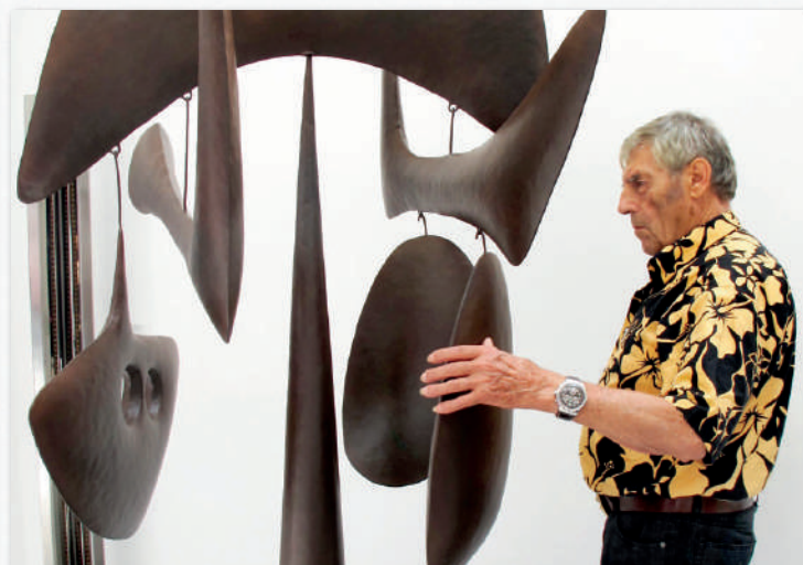
Philippe Hiquily et Cheng San, 2006, Mobile en acier martelé, H.220 x L.76 x P.68 cm, éd. à 8 ex. + 4 EA