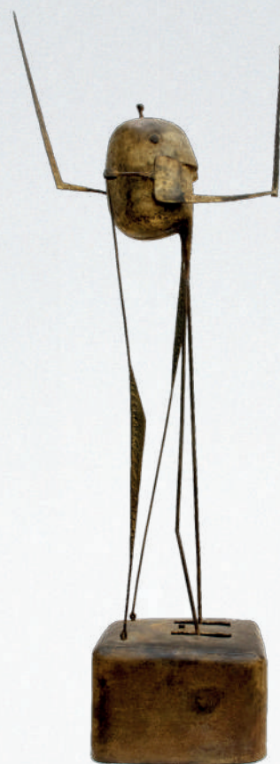
Daddy longlegs, 1957, Fer martelé forgé, H. 92,5 x L. 30 x P. 15 cm