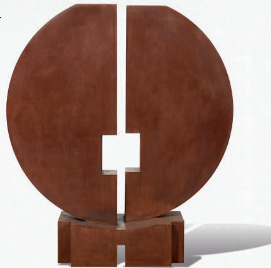
Aube , 1977, acier Corten, H. 150 x L. 132 x P. 35 cm.