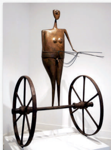
L'Aurige, 1997, Laiton patiné et roues de charrue, H. 140 x L. 92 x P. 66 cm.