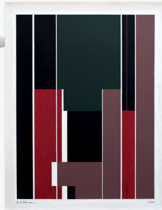
Hommage à Johannes Kepler , 2006, acrylique sur bois, H. 121 x L. 76 cm.