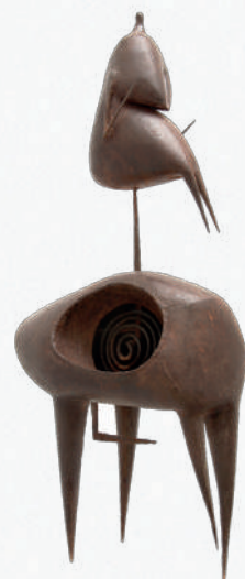
L'écuyer, 1955, Fer martelé forgé (mobile), H. 87 x L. 39 x P. 23,5 cm